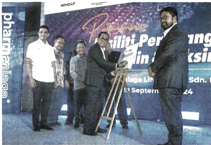
MOHAMED Khaled Nordin (dua kanan) menandatangani plak simbolik Perasmian Fasiliti Pengilangan Insulin dan Vaksin di Pharmaniaga LifeScience Sdn Bhd di Puchong, semalam.

"Pengalaman tersebut memberi pengajaran besar, bahawa kita mesti serius dalam membangunkan kekuatan serta keupayaan negara dalam bidang kritikal seperti farmaseutikal.