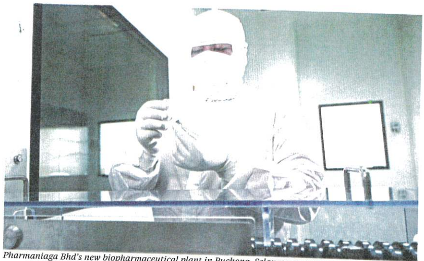
Pharmaniaga Bhd's new biopharmaceutical plant in Puchong, Selangor.

According to the company's filing with Bursa Malaysia in February, its substantial shareholders, the Armed Forces Fund Board (LTAT) and Boustead Holdings Bhd, were supporting this strategic initiative.