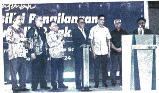
MOHAMED KHALED (tengah) melakukan gimik perasmian Fasiliti Pengilangan Insulin dan Vaksin di Pharmaniaga LifeScience Sdn. Bhd. di Puchong, semalam.

"Maknanya Pharmaniaga bersedia untuk memenuhi keperluan KKM," katanya pada sidang media selepas merasmikan Fasil-